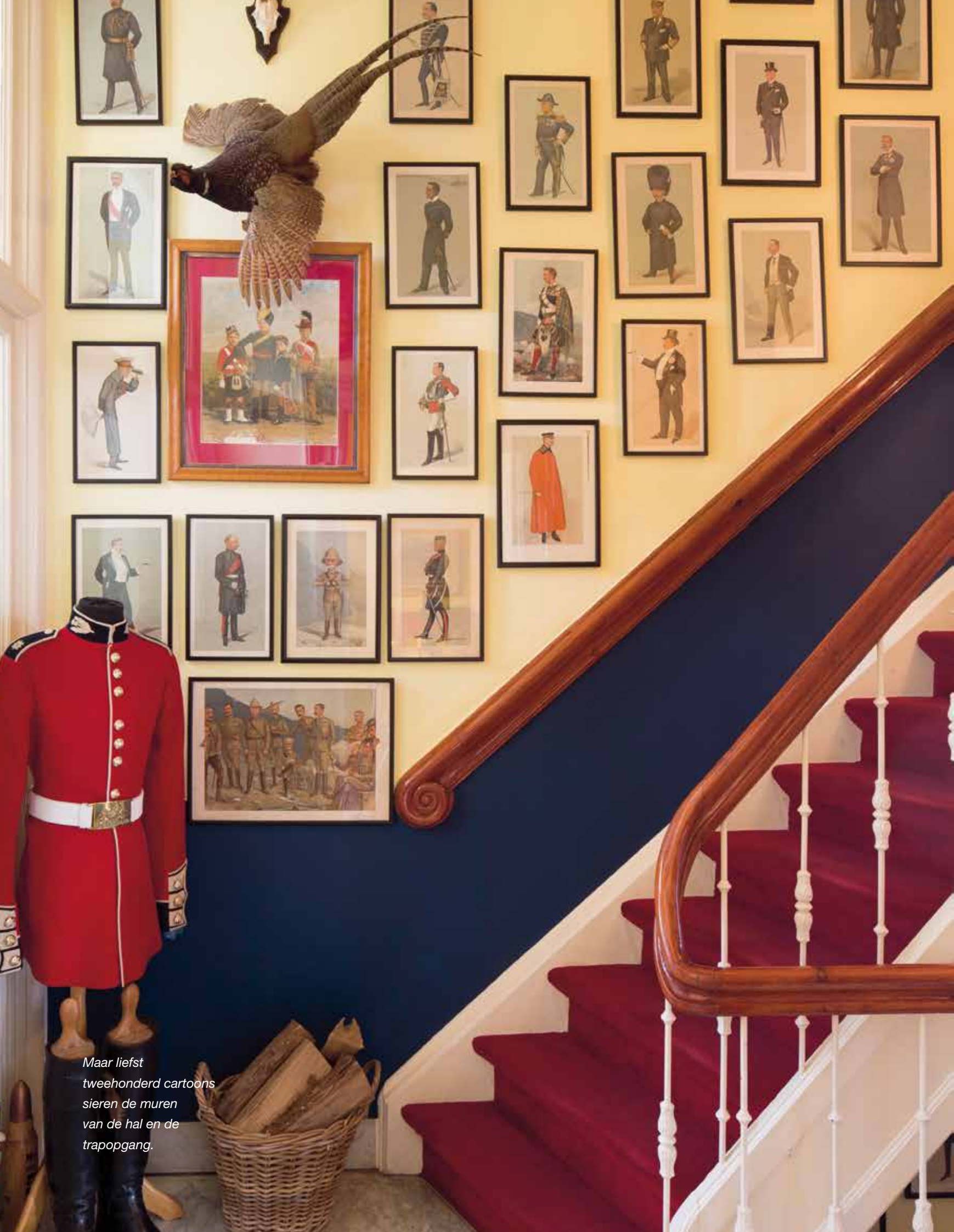
Maar liefst tweehonderd cartoons sieren de muren van de hal en de trapogang.