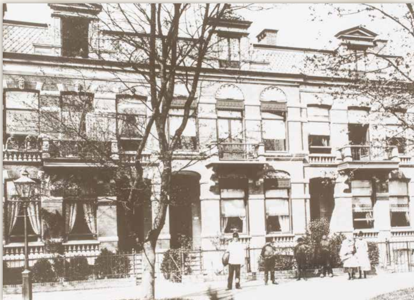
Een oude zwart/wit foto laat zien dat er honderd jaar na dato niet veel veranderd is aan het herenhuis.