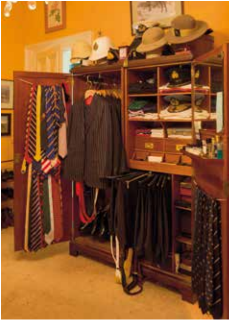
De Compactum Wardrobe herbergt alle smaakvolle pakken en accessoires.